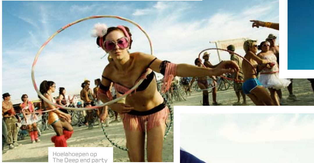
Hoelahoepen op The Deep end party