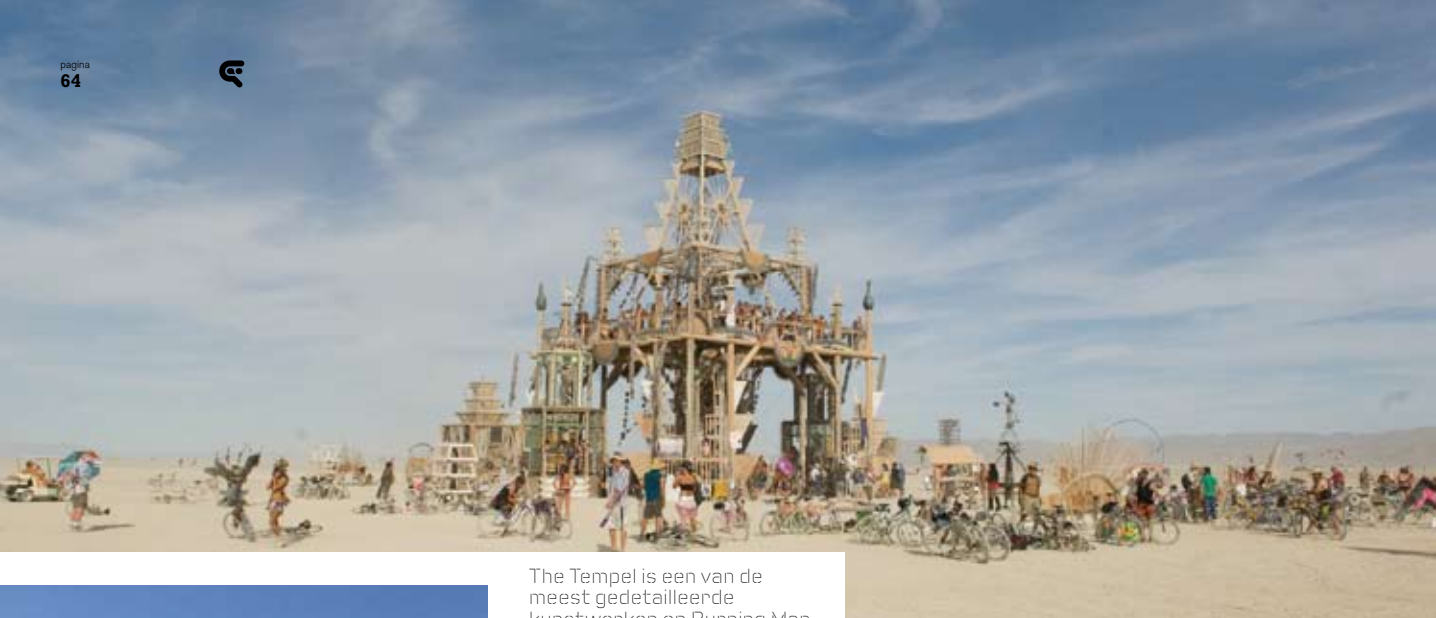
The Tempel is een van de meest gedetailleerde kunstwerken op Burning Man