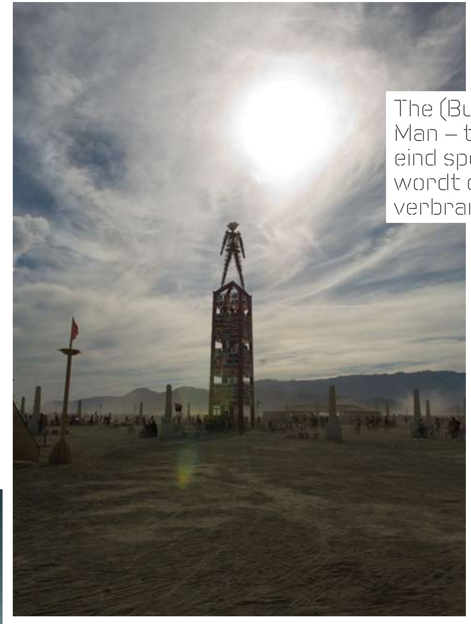
The (Burning) Man – tijdens het eind spektakel wordt deze ritueel verbrand